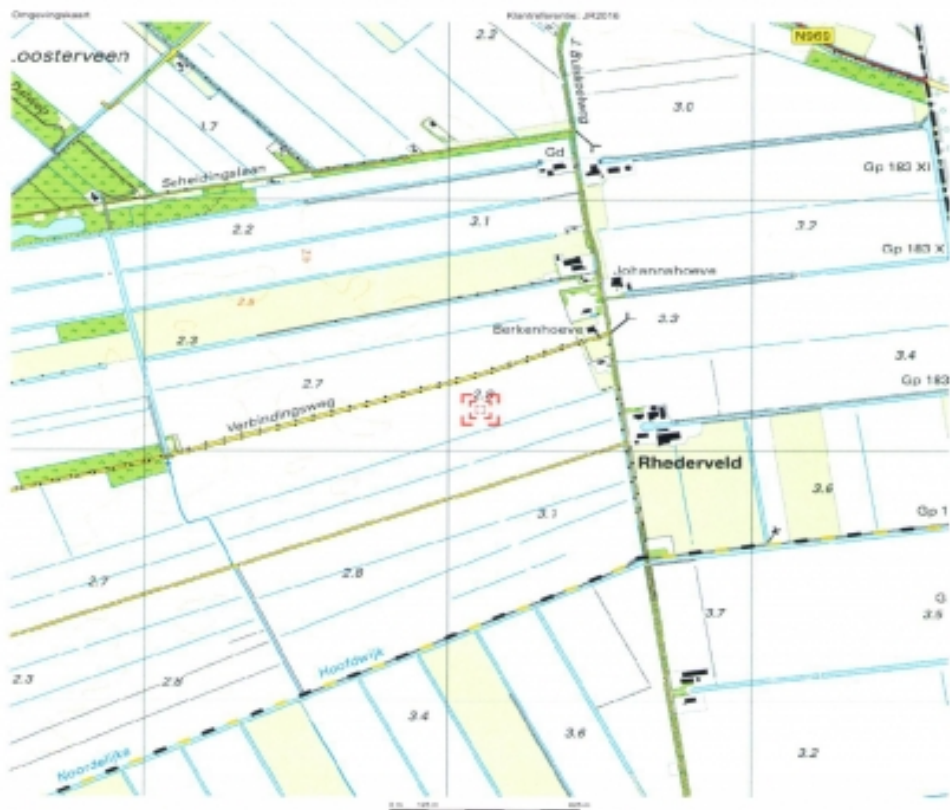
Deze kaart is noordgericht. Hier bevindt zich Kadasteraal object BELLINGHOLDE 0 921 J BUSDOLWJ - VRIESCHELOO CC-BY Kadaster. Schaal 1: 12500